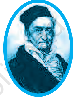
कार्ल फ्रैड्रिक गॉस (1777 – 1855)

अंकगणित की आधारभूत प्रमेय के रूप में विख्यात होने से पहले, प्रमेय 1.2 का संभवतया सर्वप्रथम वर्णन यूक्लिड के एलीमेंट्स की पुस्तक IX में साध्य (proposition) 14 के रूप में हुआ था। परंतु इसकी सबसे पहले सही उपपत्ति कार्ल फ्रैड्रिक गॉस (Carl Friedrich Gauss) ने अपनी कृति डिसक्वीशंस अरिथिमेटिकी (Disquisitiones Arithmeticae) में दी। कार्ल फ्रैड्रिक गॉस को प्रायः 'गणितज्ञों का राजकुमार' कहा जाता है तथा उनका नाम सभी समयकालों के तीन महानतम गणितज्ञों में लिया जाता है, जिनमें आर्किमिडीज़ (Archimedes) और न्यूटन (Newton) भी सम्मिलित हैं। उनका गणित और विज्ञान दोनों में मौलिक योगदान है।